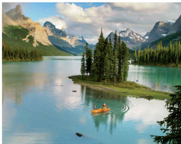
Schitterend bergmeer in de Rocky Mountains.

U krijgt er geen genoeg van. Middenin de natuur overnachten op één van de campgrounds. De relaxte sfeer van een stadje in de bergen zal ook iedereen goed doen. Hier bent u in een eigen wereld.