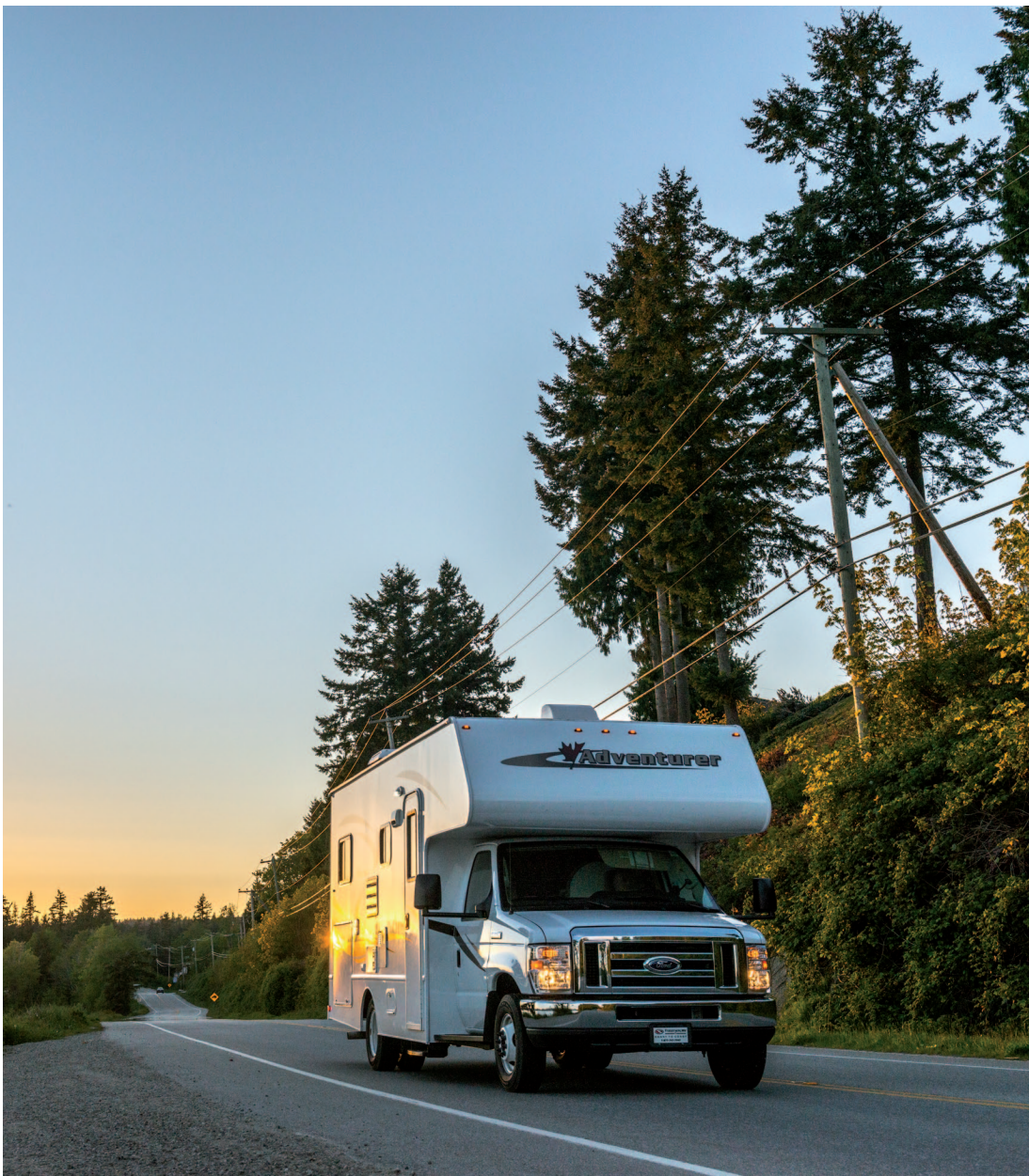
Rijden met de camper, heerlijk vrij en alles kan.

De service van de camperverhuurder is goed geregeld want we werden opgehaald bij het hotel. Handig: want voor drie weken koffers mee is een aardige hoeveelheid. Zeker als de kinderen ook mee op reis zijn.