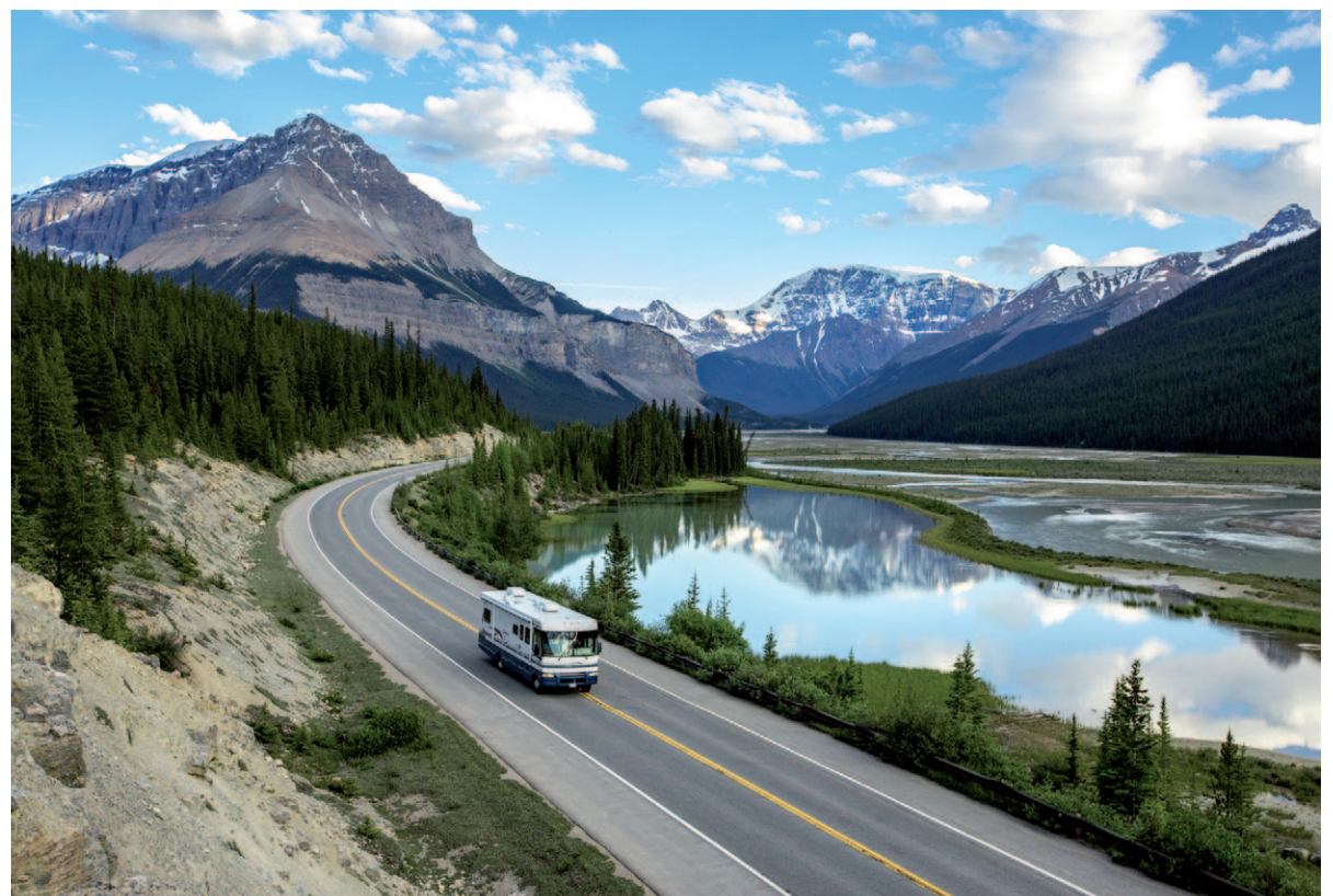
Met de camper meteen de natuur in.

Helemaal onbekend is Canada mede daardoor niet. Uiteraard ook door het schaatsen in