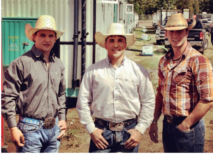
Cowboys bij de Grande Prairie Stampede.