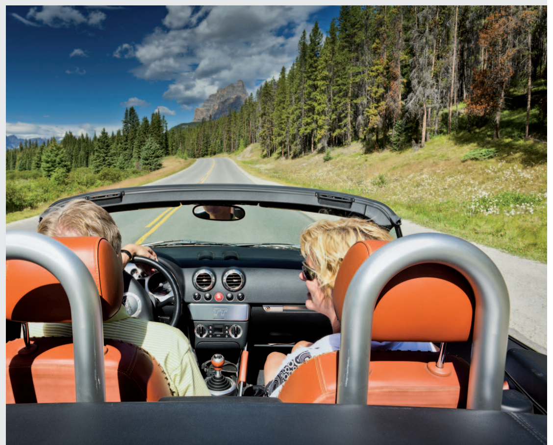
Eindeloze wegen, heerlijk rijden.

Wat de flexibiliteit betreft is dat met de auto ook prima geregeld. Aan de ene kant kunt u de route uitstippelen en van te voren samen met een reis-expert de accommodaties onderweg regelen. Ook kunt u een stop maken op de plek die interessant of mooi is en ter plekke een accommodatie regelen. Gezien het aanbod, zeker buiten de grote steden, kan dat laatste een prima oplossing zijn voor de overnachtingen.