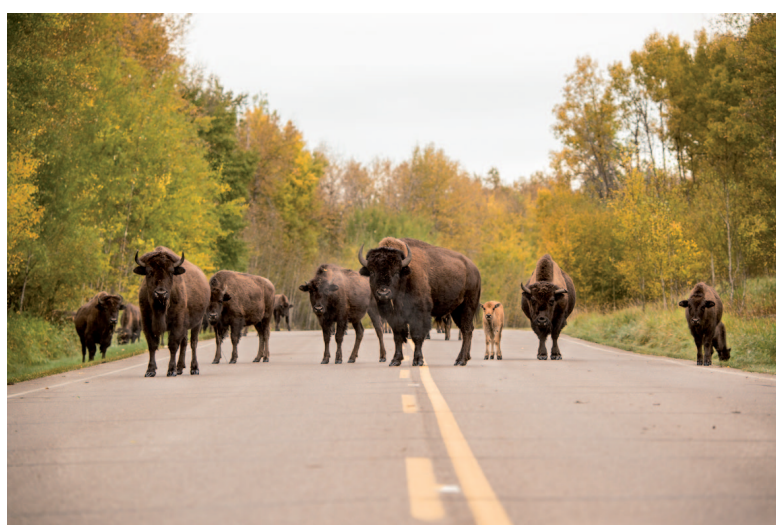
Bizons in Elk Island National Park

Op die manier wennen aan het Canadese leven, het weer, de tijdzone. Het is prima te doen. De volgende dag verder naar het onbekende; het noorden, de Rocky Mountains in het westen of het verrassende gebied tussen Edmonton en Calgary.