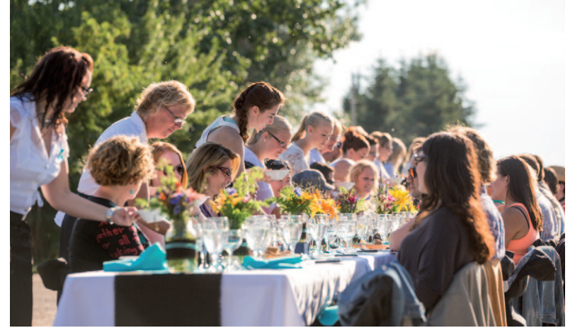
Long Table Diner in Markerville.