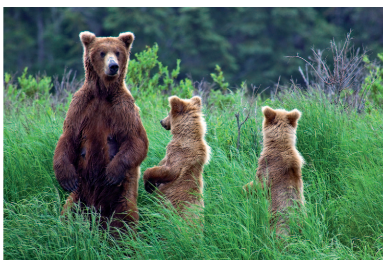
Beren, bewoners van de vele natuur.