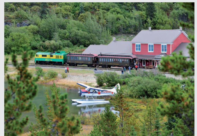
Comfortabel reizen via de White Pass & Yukon Railroad.

De goudkoorts deed meer met de mens dan alleen de drang om fortuin te maken. Hardwerkende familiemannen werden "beesten met een hart van steen", zoals de schrijver Jack London ze omschreef. De auteur reisde zelf met de karavaan mee over de White Pass Trail (van Skagway naar Bennet) en zag hoe mannen hun zwaarbepakte paarden afbeulden.