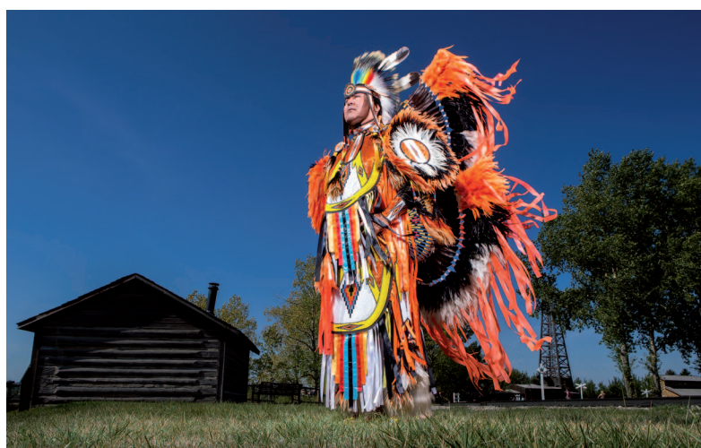
De geschiedenis van de oorspronkelijke bewoners wordt gekoesterd.