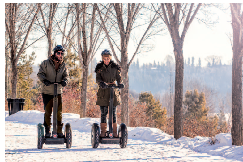
Op de Segway door de stad, ook in de winter.