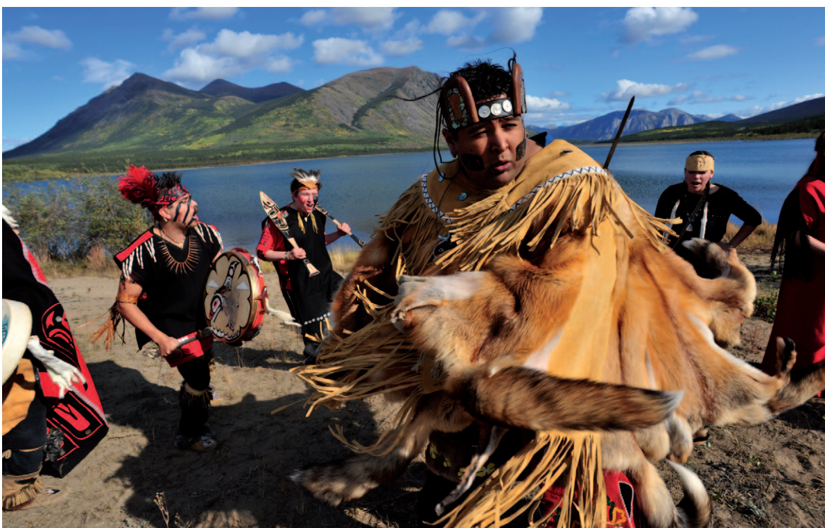
Traditie in ere gehouden; dansers van de Dakka' Kwa'an stam in Carcross.

De gemakkelijke manier is met de trein via de White Pass & Yukon Railroad van Skagway naar Whitehorse. Comfortabeler, dan de goudzoekers destijds, maar eveneens dwars door het schitterende landschap.