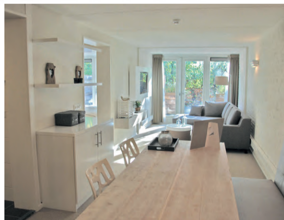
StrandResort Schier | Nederland