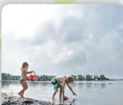
Even pootje baden