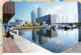
Winkelen met je sloepje