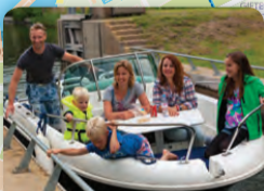
De modernste sluisen