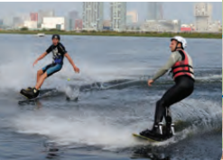
Sensatie op het water