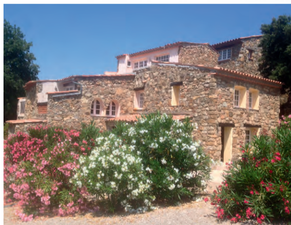
Hameau des Claudins | Frankrijk

5% huurgarantie mogelijk op onderstaande projecten