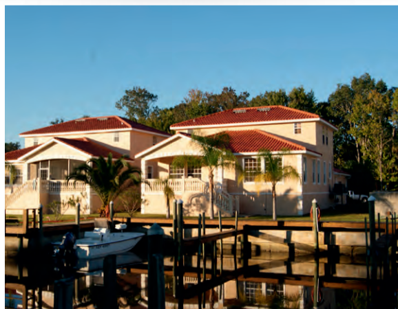
TradeWinds Homosassa Marina Resort | Florida, USA