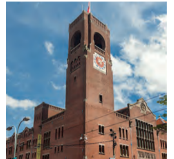
Beurs van Berlage

Volgens Schonenberg is Artist-IQ uitstekend geschikt om uit te groeien tot een evene-