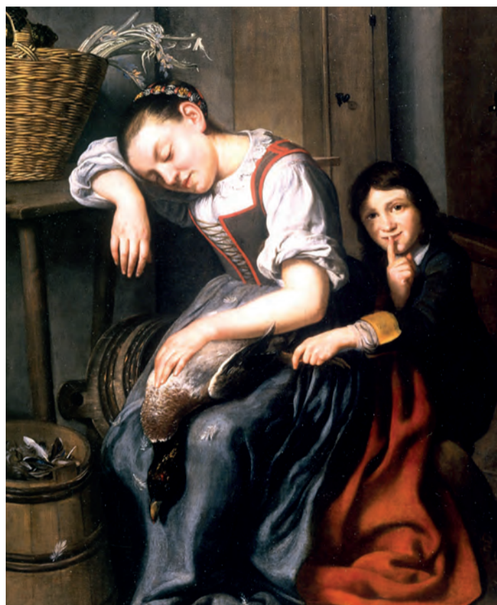
'De jonge dief' van Pieter Gerrits van Roestraten