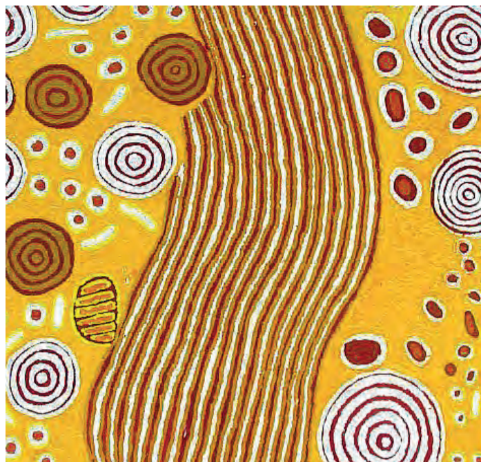
'De vrouwen-ceremonie' van Narabri Nakamara, 2008